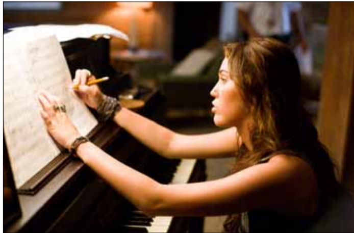
Toisistaan erilleen ajautuneita isää ja tyttäätä yhdistää musiikki, vaikka tytär (Miley Cyrus) pyrki suojautumaan siltäkin pettymysten pelossa.